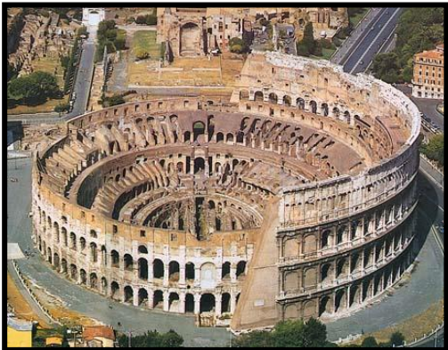
Pregunta 1 (2 puntos)