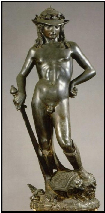
Pregunta 3 (2 puntos)