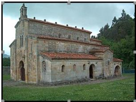
Pregunta 2 (2 puntos)