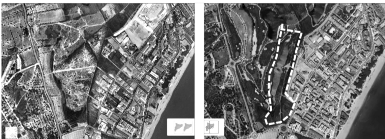
Ortofotomapa de la Pineda (Vila-seca)

A l'esquerra, imatge de l'any 2000. A la dreta, imatge vigent l'any 2019. En la imatge del 2019 s'assenyala amb una línia discontinua una zona del PEIN.