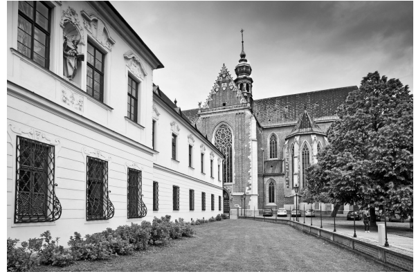
Jardins del convent de Brno (Txèquia), on Mendel va fer els experiments amb pesoleres / Jardines del convento de Brno (Chequia), donde Mendel hizo los experimentos con guisantes