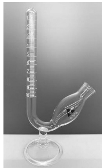
Sacarímetre / Sacarímetro